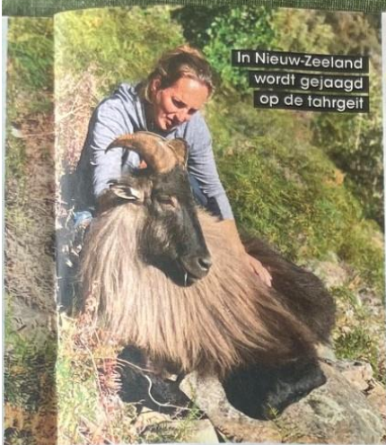
In Nieuw-Zeeland wordt gejaagd op de tahreig