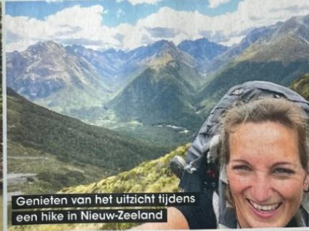
Genieten van het uitzicht tijdens een hike in Nieuw-Zeeland