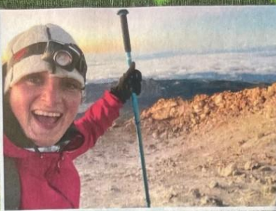
De dieren werden even ingeruild voor een sneeuwscooter in Colorado