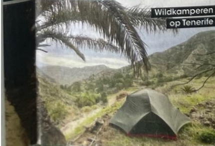
Wildkamperen op Tenerife