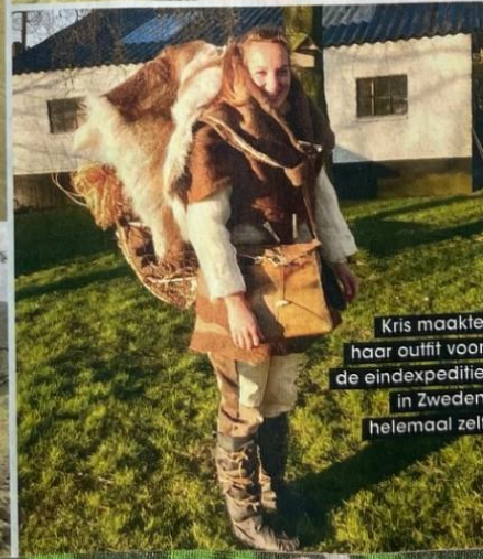
Kris maakte haar outfit voor de eindexpeditie in Zweden helemaal zelf

TEKST: MARIËTTE MIDDELEEK. FOTOS: PRIVÉBEZIT