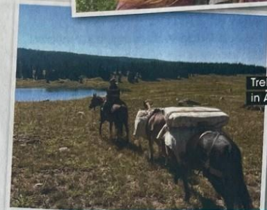
Trektocht in Amerika

'Als ik in Nederland bleef, zou ik nooit het leven leiden dat ik wilde'