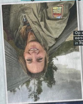
Op een van de eerste dagen in Peru