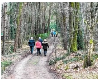
We gaan u weer verrassen met nieuwe paadjes.

Ten zesde: Wandelen is gewoon een fijne, ontspannende bezigheid waar je fit en vrolijk van wordt. Bij