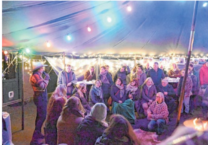
Gezellig warm om het kampvuur in de yurt luisteren naar alle verhalen en anekdotes.